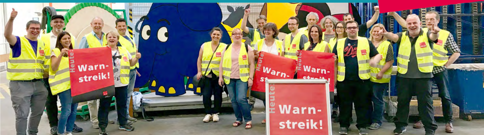
Wir lassen uns nicht spalten: Jung und Alt streiken gemeinsam in Bocklemünd