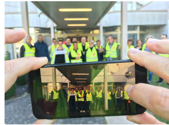
Beitragsservice im Streik

Am vergangenen Dienstag hatte ver.di den Streikschwerpunkt in der Kölner Innenstadt. An der Streikversammlung auf dem Vorplatz des Museums für Angewandte Kunst versammelten sich rund 400 Kollegen*innen. Viele beteiligten sich zum ersten Mal und bekräftigten damit ihre Forderungen eindrücklich. Am Donnerstag stand das WDR-Produktionsgelände in Bocklemünd im Fokus. Die Kollegen*innen des Beitragsservice riefen ihre Kollegen*innen zum Warnstreik auf und erreichten mit rund 250 Kollegen*innen eine starke Teilnahme. Selbst Tele-Arbeitnehmer*innen, die Telefongespräche für den Beitragsservice auffangen sollten, setzten ein Zeichen und leg-